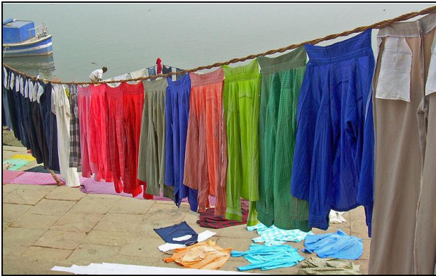
Colada cerca del río, Varanasi, India

Pida a sus alumnos que hagan una lista de todas las formas en que piensen que el agua puede llegar a la atmósfera (para formar vapor de agua). Puede iniciar la lista con ejemplos como: un cazo de agua hirviendo; una colada puesta a secar; de la respiración; de un lago.