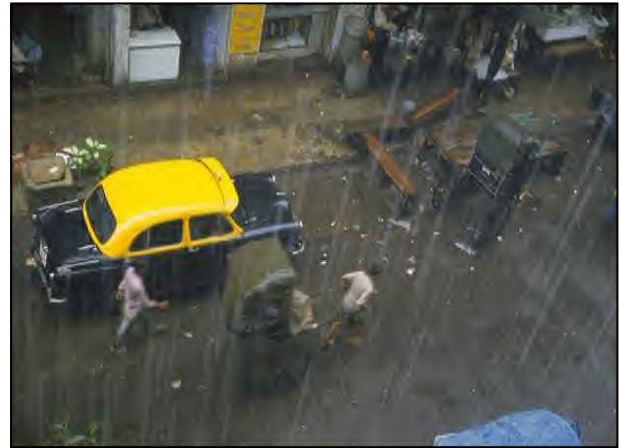
Lluvia en las calles de Calcuta, India.

Seguidamente, pida una lista de todas las formas en que el agua puede ser transportada. Pistas: vapor de agua que se evapora i asciende en el aire; lluvia que cae; infiltración en el suelo; glaciares que se mueven.