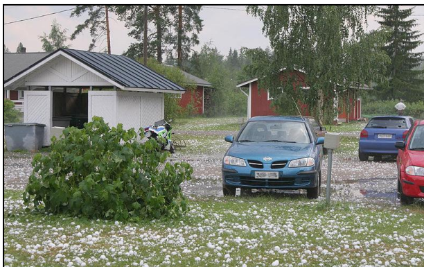
Granizo sobre Finlandia, 10 de Julio de 2006.

Ahora pida a los alumnos que hagan una lista de las formas en que creen que el agua puede salir de la atmósfera. Posibles pistas: condensación en una ventana; condensación en forma de gotitas que, posteriormente caen en forma de lluvia.