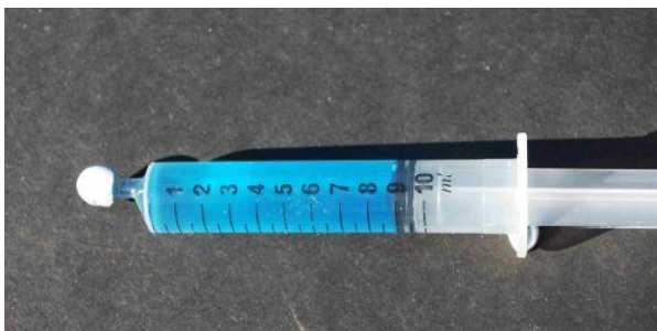
La jeringa llena de agua hasta la marca de 9 ml.

La mayoría de los alumnos saben que el agua se dilata cuando se congela, pero ¿cuánto? Demuéstrelo como sigue. Llene una jeringa de 10ml o 20ml con agua fría, sellando su pico (con Blu Tac™ o arcilla). Los resultados son más claros si se tiñe ligeramente el agua con colorante alimentario, como se muestra en las fotos. Mida la longitud de la columna de agua en milímetros. Póngalo en el congelador hasta la lección siguiente. Mida la longitud de la columna de hielo en milímetros, y calcule el porcentaje de dilatación del agua que se ha transformado en hielo así: (\text{longitud del hielo} - \text{longitud del agua}) / (\text{longitud del agua}) \times 100\% .