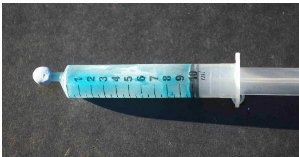
La jeringa después de congelarse.

Muestre a los alumnos fotos de “daños por congelación”, pero recuérdelos que es la sucesiva congelación y descongelación lo que finalmente meteoriza las rocas, más que un único episodio de congelación.