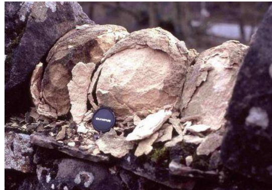
Efecto de la congelación/descongelación sobre una caliza porosa

Muestre a los alumnos fotos de “daños por congelación”, pero recuérdelos que es la sucesiva congelación y descongelación lo que finalmente meteoriza las rocas, más que un único episodio de congelación.