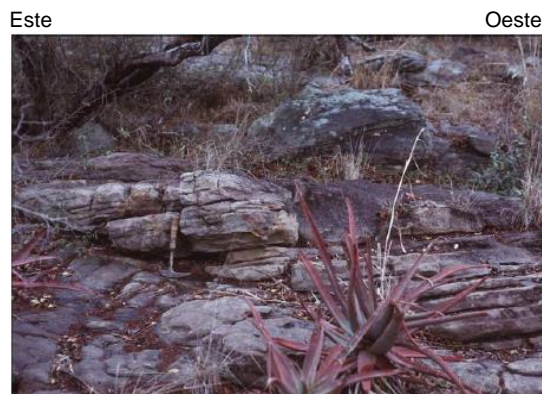
Foto 2. Areniscas con estratificación cruzada de Suazilandia que contienen diamantes.

La Foto 1 fue tomada por un geólogo que hacía prospección de diamantes en Suazilandia en el sur de África que encontró las areniscas de las fotos 1 y 2. Las areniscas contenían diamantes procedentes de un yacimiento situado a kilómetros de distancia. Teniendo en cuenta la Foto 2, decida hacia dónde deberá dirigirse el geólogo para intentar encontrar el origen de los diamantes.