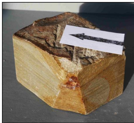
Foto 5: Vista tridimensional del mismo bloque de arenisca.

La respuesta en este caso es de izquierda a derecha. ¿Cómo puede ser esto? Es importante que entiendan que la estratificación cruzada es un fenómeno tridimensional. Ahora muestre a los alumnos la Foto 5 y pídale que establezcan la dirección de la estratificación cruzada, ahora que tienen una visión tridimensional (hacia la cámara). Finalmente, si la flecha señala el Norte, ¿en qué dirección fluía la paleocorriente? ( Hacia el Oeste; es decir, desde el Este).