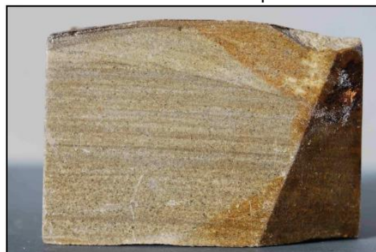
Foto 4: El mismo bloque de arenisca de la Foto 3 girado 90°. (Foto: Peter Kennett).

Ahora muéstrelas la Foto 4 que da una visión del mismo bloque girado 90° y pídale que digan nuevamente la dirección de la paleocorriente.