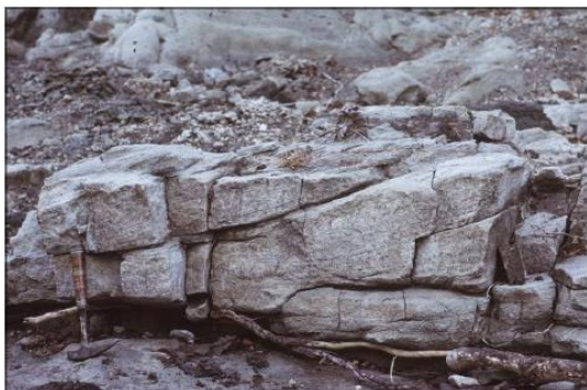
Foto 1. Arenisca con estratificación cruzada de edad jurásica, de Suazilandia.

Use la Foto 1 para preguntar en qué dirección fluía la corriente cuando se depositó esta arenisca (R: de izquierda a derecha).