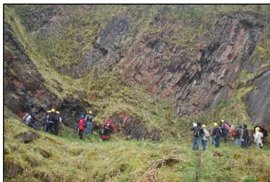
Elever vurderer hva området kan brukes til. Apes Tor, Staffordshire, UK. (Chris King).