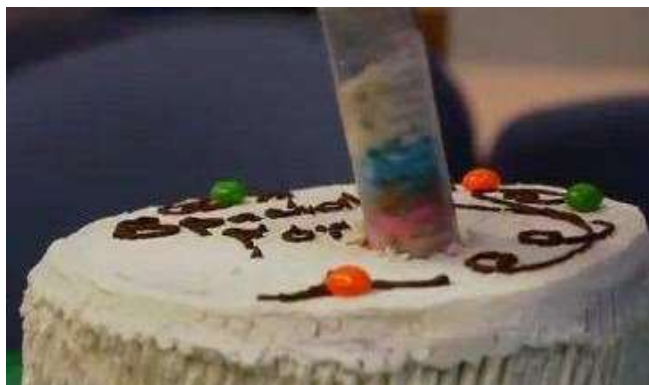
“Perforación” de un pastel para obtener un testigo de sondeo.

Si es posible, muestre a sus alumnos el videoclip filmado desde el Resolution, un barco de investigación y perforación oceánica. http://joidesresolution.org/node/2038 . Esto introduce la actividad.