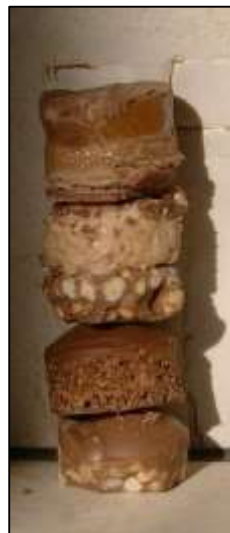
Testigo de un “sondeo” a través de 4 barras de chocolate

embargo, necesitará un cilindro que encaje dentro del tubo para empujar el testigo hacia fuera. En la foto de debajo se puede ver el resultado de hacer un sondeo a través de cuatro barras de chocolate diferentes.