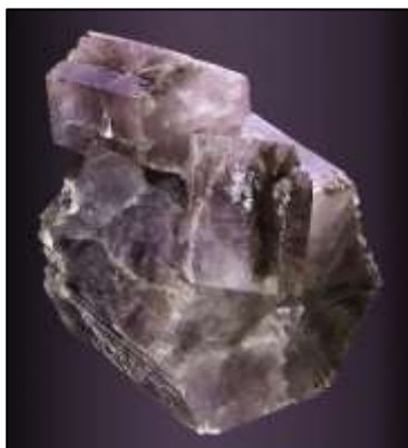
Aragonita (Vegeu font al final)

Pregunteu als vostres alumnes quina de les següents mostres és el carbonat de calci més pur? Tot seguit, guieu la discussió per tal de donar les millor respostes (com es mostra s les notes de sota).