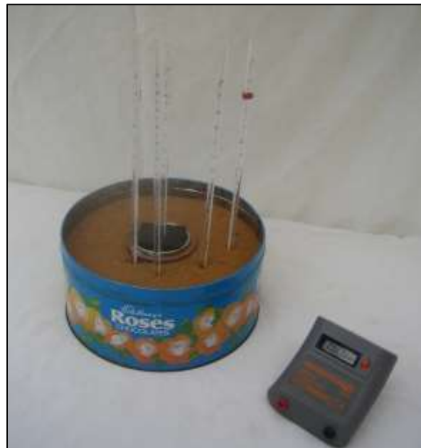
Montaje preparado para medir la velocidad de enfriamiento alrededor de una "intrusión" usando una lata de metal con tapa en el centro y cinco termómetros. (Mike Tuke).

El montaje consta de una caja de galletas o recipiente redondo (que puede ser de plástico). En el centro sitúe una lata o un vaso de precipitados, con tapa, pero no la llene de agua caliente hasta que esté todo a punto; llene el espacio alrededor con arena seca e inserte 3 o 4 termómetros, o sensores de temperatura a diferentes distancias del recipiente central, con los bulbos o los sensores a unos 5cm de profundidad.