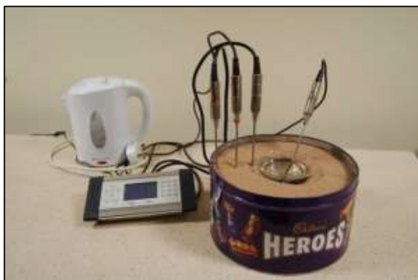
Montaje listo para medir la velocidad de enfriamiento alrededor de una "intrusión" de agua caliente usando un vaso de precipitados en el centro y una consola con 4 sensores. (Chris King).

Si los estudiantes usan termómetros, pídeles que preparen una tabla como la siguiente, pero con unas 30 filas. Si disponen de sensores, la pantalla les dará un gráfico de las variaciones de temperatura con el tiempo.