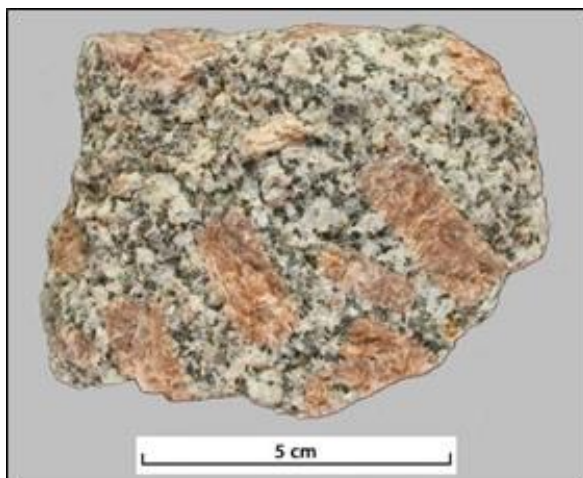
Muestra de granito. (Peter Kennett ara la ESEU).

Muestre a sus alumnos el modelo de fusión parcial y una muestra de roca ígnea, como el granito, y haga las preguntas de la tabla. También se muestran respuestas probables tras una discusión.