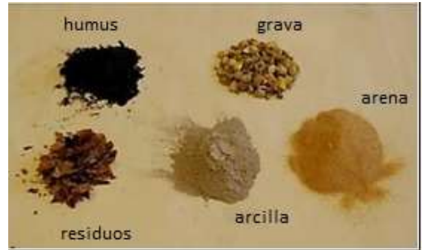
La Earthlearningidea “Haz tu propio suelo”. (Elizabeth Devon).

R. Plante algunas semillas en el suelo y observe cómo crecen los días y semanas siguientes.