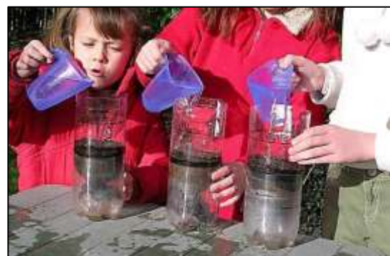
La Earthlearningidea “La gran carrera del suelo”. (Peter Kennett).