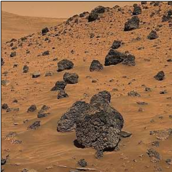
Regolita (material superficial no edáfico) fotografiado por el vehículo de exploración de Marte "Spirit".

El suelo nos parece muchas veces una sustancia sin vida que simplemente recubre muchas partes de la superficie terrestre. Sin embargo, los alumnos deberían ser conscientes de que si el suelo no contuviese materia orgánica (viva y/o muerta) no sería un suelo, sino roca meteorizada sobre la superficie terrestre sin signos de vida. Estos restos no edáficos se denominan regolitas, y se pueden encontrar en las cimas de las montañas y en las regiones polares de la Tierra, así como en la luna o en planetas como Marte.