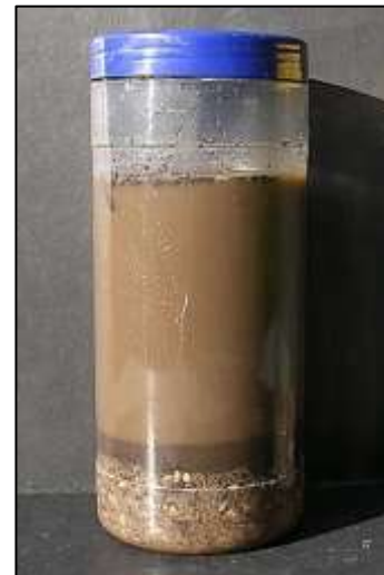
La Earthlearningidea “Agitando suelo y agua”. (Peter Kennett).