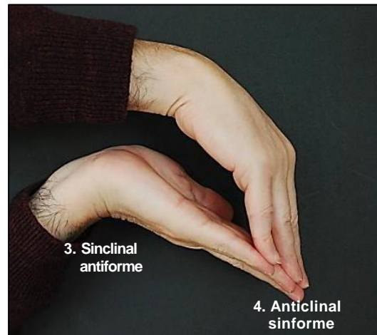
Seqüència de roques plegades en un mantell.