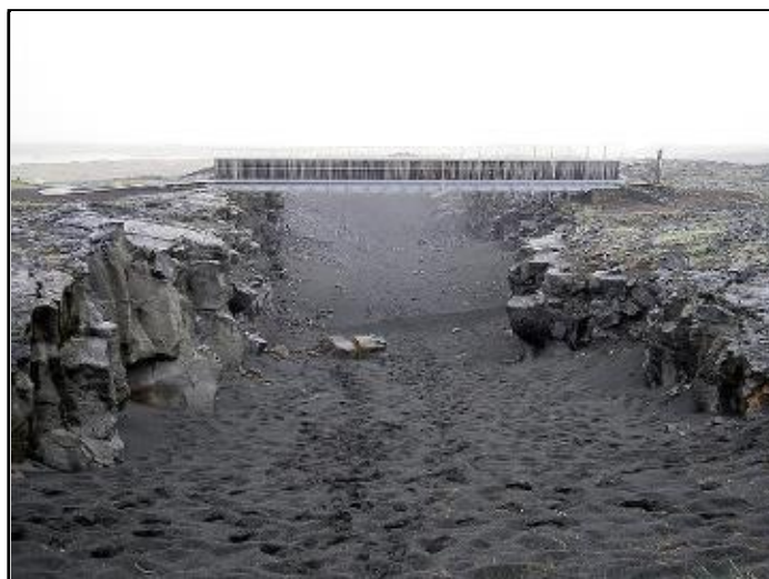
Separació entre les plaques Nord-americana i Europea a Islàndia