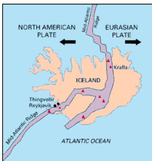
La dorsal atlàntica a Islàndia