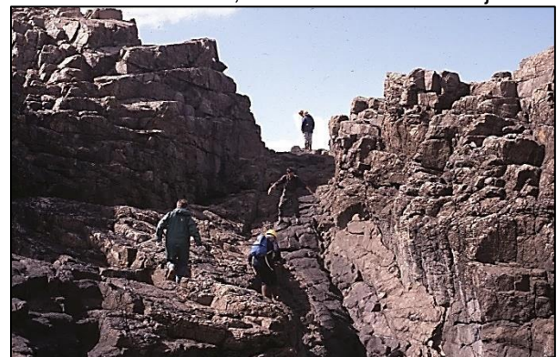
Un dique meteorizado entre una roca más resistente, Orkney, Escocia.

A pesar de que las rocas ígneas son normalmente muy duras y resistentes y, por eso, constituyen las tierras altas, los minerales que forman las rocas ígneas oscuras pueden ser menos resistentes a la meteorización y la erosión que los minerales de las rocas de su alrededor, formando así tierras bajas.