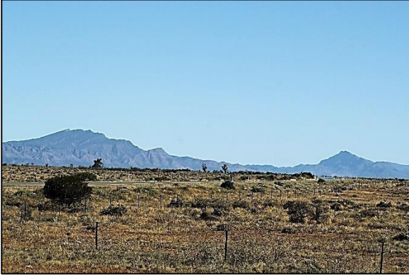
Topografía invertida – la zona baja del centro es un anticlinal erosionado, la región más alta de la izquierda es un sinclinal; Wilpena Pound en los Flinders Ranges, Australia.