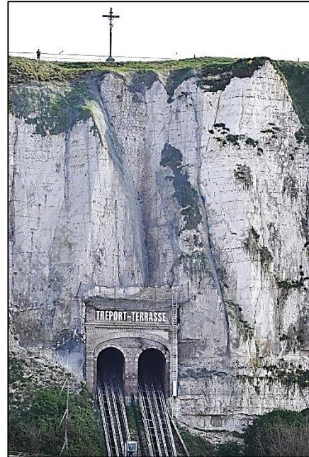
Túnel de tren en un acantilado de creta, Le Treport, Normandía, Francia.