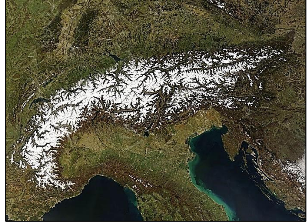
Los Alpes, en Europa, cubiertos de nieve, con rocas más antiguas, y a menudo más duras, a los lados.

Un ejemplo bien conocido es el sinclinal que forma Snowden, la montaña más alta de Gales e Inglaterra.