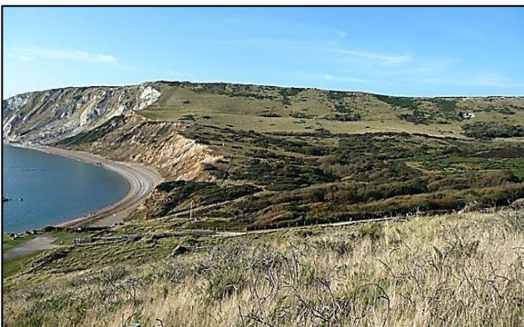
Lomas de creta y un acantilado de creta, con rocas más débiles al fondo, Tyneham Gwyle, Dorset, Inglaterra.

La caliza fina y blanca denominada creta es tan blanda que se puede usar para escribir en una pizarra y, sin embargo, es suficientemente dura para formar acantilados y crestas. Esto es así porque, a pesar de que es fácil romper la roca, tiene muchas fracturas y grietas que permiten un drenaje rápido del agua de lluvia, reduciendo de esta forma los efectos erosivos del agua. Otras rocas “blandas” pueden ser parecidas.