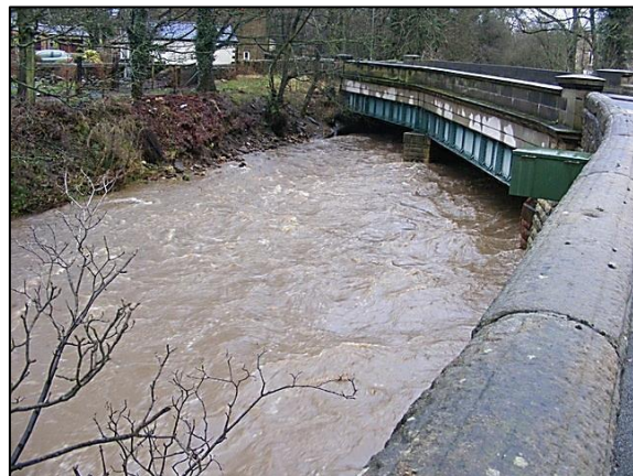
El Gill Beck durante una tormenta fuerte.