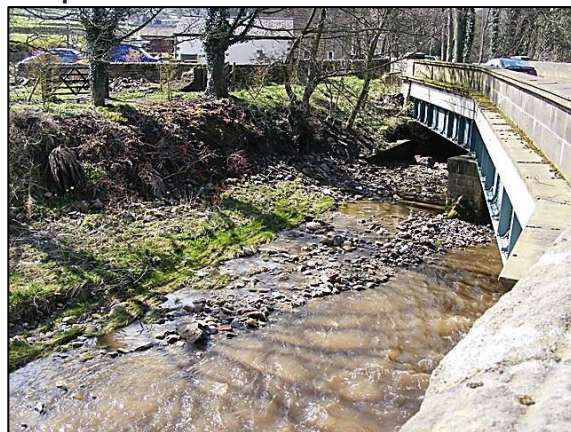
El Gill Beck en Glusburn, Yorkshire, GB en condiciones normales de flujo.