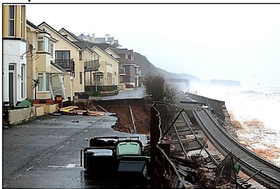
Frente marítimo en Dawlish, Devon, Inglaterra después de los violentos temporales de 2014.

Esta es la línea principal que conecta Cornualles con el resto del país, construida en el reinado de la reina Victoria. El temporal rompió el muro y erosionó todas las rocas que aguantaban la vía