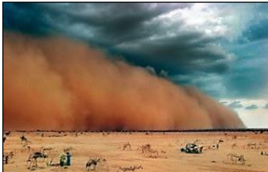
Una tormenta de arena en una zona desértica.