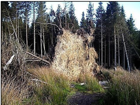
Un árbol abatido por el viento en el mismo bosque de Escocia. (© Iain Thompson con licencia para su uso de Creative Commons).

Quando sopló el viento las raíces del árbol fueron movilizadas y esto debilitó el suelo facilitando su erosión por el viento. El suelo expuesto al aire caerá y será erosionado más rápidamente.