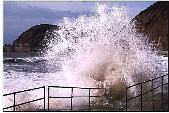
Mar dura en Sidmouth, Devon, Inglaterra.

Cada vez que una ola golpea la costa, lo hace con la fuerza de muchas toneladas de agua en pocos segundos. El agua también comprime el aire atrapado en las fracturas de las rocas o de los muros y esto puede separar fragmentos grandes de estos. ¿Qué podría pasarle al muro y la vía de tren de la imagen de Dawlish durante un temporal violento?