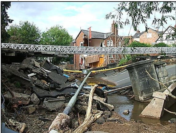
El puente de Burway sobre el río Corve, Ludlow, Inglaterra, después de las inundaciones. (© Copyright DI Wyman con licencia para su uso de Creative Commons ).

Este no es el mismo río pero los efectos podrían ser muy similares, con los pilares erosionados hasta el colapso del puente, árboles arrastrados, pies de iluminación también arrancados, etc.