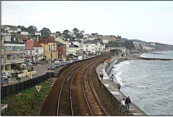
El frente de mar en Dawlish, Devon, Inglaterra el 2003.