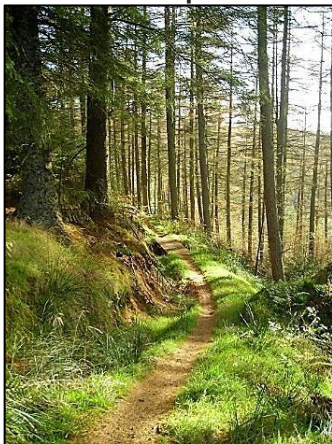
Una imagen tranquila en un bosque de Escocia.

(© Iain Thompson con licencia para ser usada Creative Commons ).