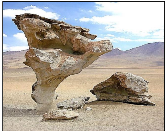
Erosión por viento en la Región del Altiplano de Bolivia.

Como que la arena transportada por la tormenta no se puede mantener muy arriba en el aire, la mayor parte de su acción erosiva tiene lugar cerca del suelo. Estas formas recortadas son típicas de la erosión eólica en áreas secas.