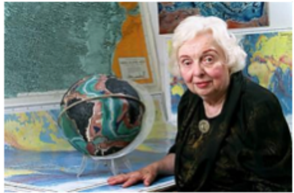
Marie Tharp all'età di 80 anni

larga e più lunga catena montuosa sulla Terra, profonde fosse oceaniche e montagne sottomarine sparse, e anche pianure. Luglio 2020 ha segnato il centenario della nascita di Marie Tharp. Oggi è riconosciuto il suo grande contributo allo sviluppo delle scienze della Terra. Il suo lavoro innovativo è ora fonte di ispirazione per gli scienziati, e in particolare, per le scienziate, del futuro.