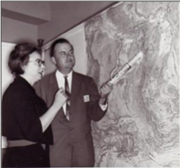
Marie Tharp e Bruce Heezen

Se questa storia fosse vera, dimostrerebbe che Marie Tharp è stata la prima persona a “scoprire” il rift di una dorsale oceanica. Tuttavia, gran parte del merito andò a Bruce Heezen, perché lui era lo “scienziato” e lei era la sua assistente “cartografa”; lui era un uomo e lei era una donna in un’epoca in cui la scienza era dominata dagli uomini.