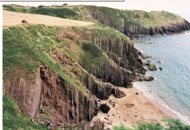
F. Altura de los acantilados 25m