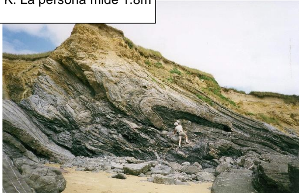
K. La persona mide 1.8m