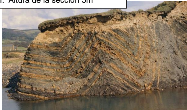
I. Altura de la sección 5m