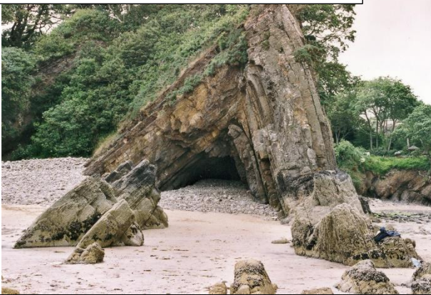
A. Altura de la sección 12m