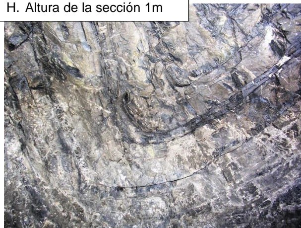
H. Altura de la sección 1m