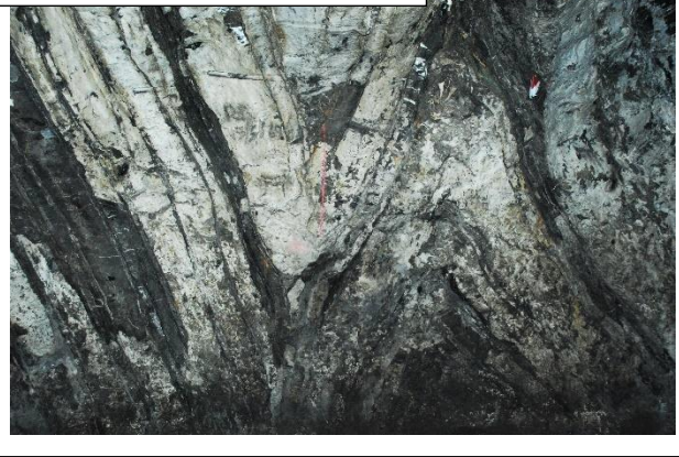
B. Altura de la sección 2m