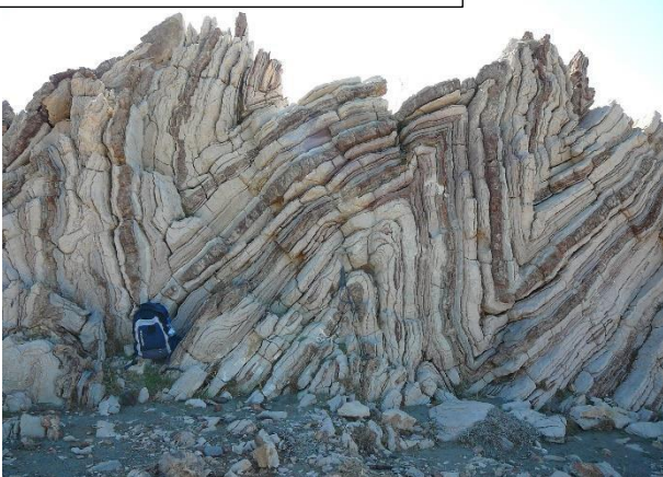
C. Altura de la sección 3m