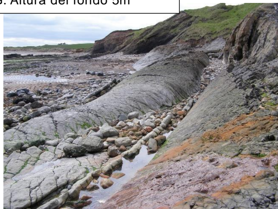
G. Altura del fondo 5m