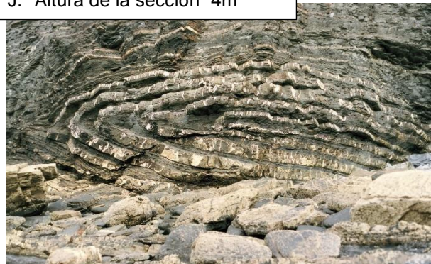
J. Altura de la sección 4m