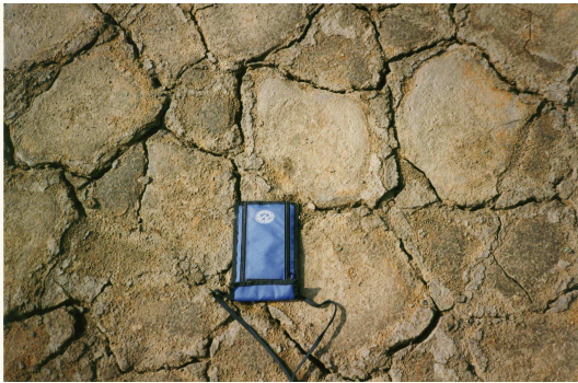
Fracturas poligonales en el banco fangoso de un lago seco en Inglaterra.

Sus alumnos habrán notado que, cuando un charco se seca, deja generalmente una película de fango que se fractura en figuras regulares (polígonos) cuando se contrae al deshidratarse.