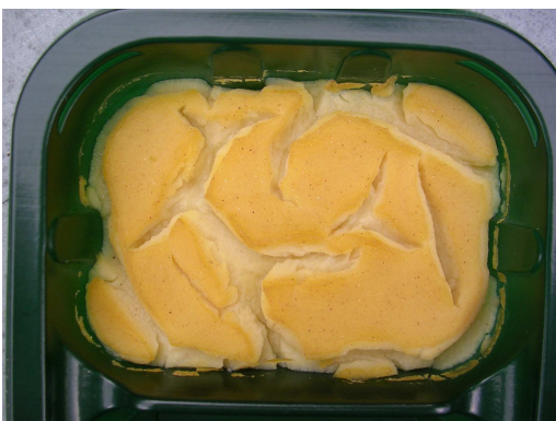
Fracturas en una pasta de harina de maíz.

Mezcle aproximadamente 50g de harina de maíz con suficiente agua como para hacer una pasta chirle. Cocínela luego sobre un fuego suave añadiendo más agua a medida que se espesa. Continúe hasta que burbujee suavemente y alcance una buena consistencia. Vierta la pasta en un recipiente de bordes empinados (no un plato playo) hasta un espesor de 2cm. Déjela enfriar, observándola cada tanto para ver que ocurre. Los resultados puede ser variables, pero en cosa de media hora la superficie debe enfriarse y contraerse. Al hacerlo se fractura en una variedad de diseños sobre su superficie. La contracción continúa por días, a medida que la pasta se seca, originándose generalmente más fracturas. Algunas de ellas pueden atravesar completamente el espesor de la masa.