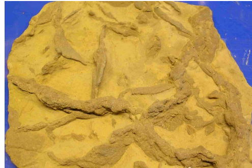
Grietas en una roca sedimentaria de 250 millones de años

Puede comparar las grietas obtenidas en la clase con las que se observan en las rocas, como las que ilustra la foto de abajo. Éstas han sido causadas por la contracción debida a la desecación.