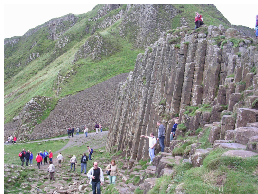
Columnas poligonales en una colada de lava en la Escalinata de los Gigantes, Antrim, Irlanda del Norte

Otras formas de fracturas poligonales se desarrollan en los mantos de lava. En los casos mejor conocidos forma columnas gigantes, de varios metros de alto y varios decímetros de diámetro. Estas columnas se han formado durante el enfriamiento, la solidificación y la contracción de la colada de lava. Es decir que se han formado por enfriamiento, no por deshidratación como en el caso de los fangos. El conjunto de fracturas desarrollado en las lavas se denomina "disyunción columnar".