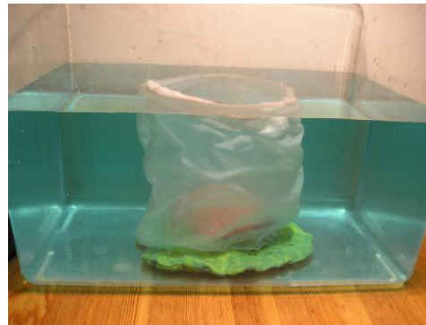
Modelo casero del atolón después que el hundimiento del volcán provoque un ascenso del nivel del mar