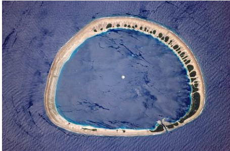
El atolón de Nukunoro en el Océano Pacífico mide unos 7 km de diámetro

Cuando Darwin navegó alrededor del mundo en el “Beagle” en los años 1830, observó pequeñas islas formadas por arrecifes coralinos circulares de poca altitud como los de las fotos adjuntas. Estos arrecifes circulares se encontraban dispersos por los océanos profundos de los trópicos. Intente “pensar como Darwin” para averiguar la forma en que se formaron.