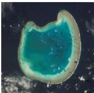
El atolón Bassas da India en el Océano Índico mide unos 15 km de diámetro

Estas fotos son de dominio público ya que fueron creadas por el Image Science & Analysis Laboratory, del NASA Johnson Space Center. La política de copyright de la NASA establece que “el material de NASA no está protegido por el copyright a menos que se indique lo contrario”.