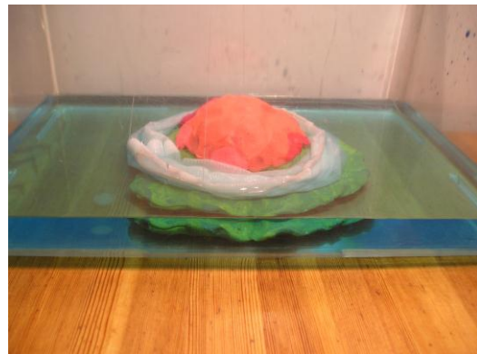
Modelo casero de atolón – antes del hundimiento del volcán

Construya su propio modelo dinámico de la “gran idea sobre el atolón coralino de Darwin” colocando un volcán cónico en un tanque como el que se muestra en la primera foto. Seguidamente construya un cilindro de tejido que encaje sobre el cono, con un círculo de alambre en su parte superior. A continuación, si se añade agua al tanque (simulando el aumento del nivel del mar a partir del hundimiento del volcán), el cilindro de ropa se elevará de forma análoga a como creció el arrecife coralino. Finalmente obtendrá un círculo de alambre vacío en la “superficie” del agua, que representa la isla atolón, tal como puede verse en la segunda foto