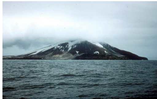
El Monte Asphyxia (1800m) de la Isla Zavodovski, Islas Sandwich del Sur tiene unos 6 km de diámetro.