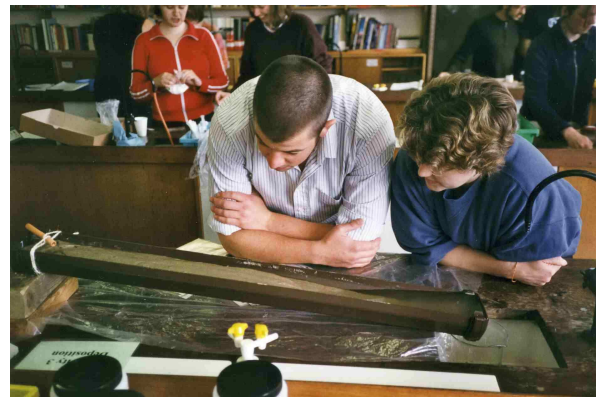
Docentes practicantes observan el movimiento del sedimento en una canaleta .

A veces puede distinguirse que las partículas más pesadas del sedimento se acumulan más fácilmente en los lugares donde la velocidad del agua tiende a disminuir. Así es como se forman los depósitos (denominados “placeres”) de minerales más densos, como el oro. El agregado de algunas partículas más pesadas, como limaduras de hierro o pirita molida, puede hacer más evidente este proceso.